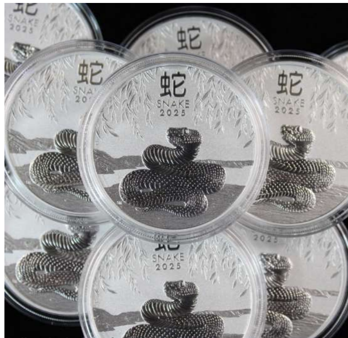
Bullion de plata Año de la Serpiente de 2025. Invermoneda