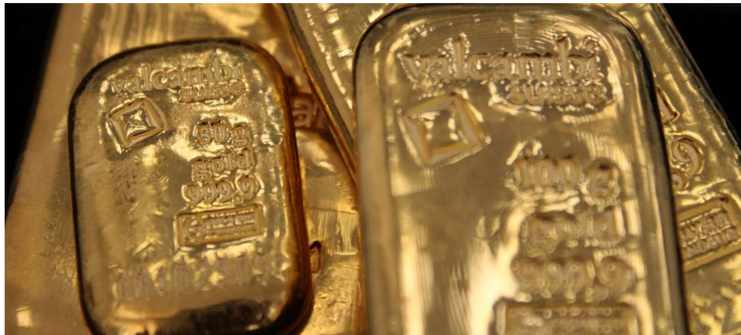
Lingotes de oro de diferente peso y acuñadas por distintas casas de la moneda. Invermoneda